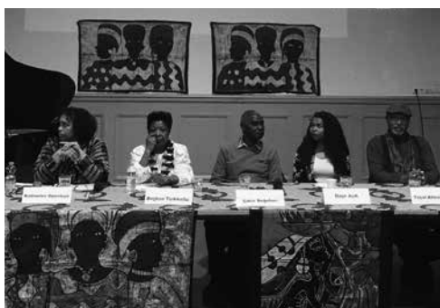
Afro-Türken bei einer Veranstaltung der Schwarzen Volkshochschule