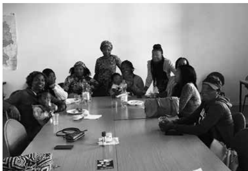
Empowerment Workshop für afrikanische Frauen

Der dritte Teilbereich widmet sich dem Empowerment afrikanischer Frauen, die durch die Angebote und Veranstaltungen der Schwarzen Volkshochschule dabei unterstützt werden, ihre soziale, berufliche und gesellschaftliche Position zu verbessern.