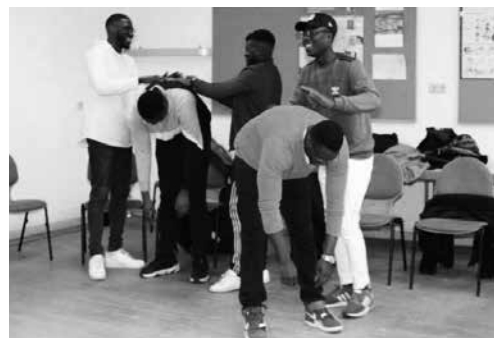
Theaterworkshop Mut zum Selbstsein