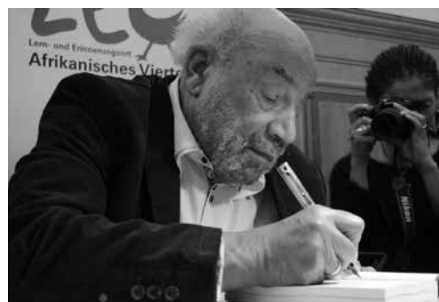
Theodor Wonja Michael († 19. Oktober 2019), Überlebender der NS-Zeit, bei der Vorstellung seines Buches „Deutsch sein und schwarz dazu: Erinnerungen eines Afro-Deutschen“