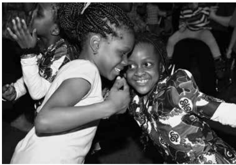
„African Kids Get Together“ beim Black History Month

Die Zielgruppe der Afro-Samstagsschule sind Berliner Kinder im Kindergarten- und Grundschulalter mit familiären Wurzeln in Ländern Afrikas. Die Kinder werden samstags in den Fächern Geschichte, Sprachen, Kultur, Rassismus, Performing Arts und Sport gemeinsam unterrichtet.