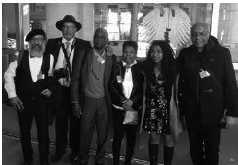
Afro-Türken aus Izmir zu Besuch in Berlin bei einer Veranstaltung mit Dr. Karamba Diaby, MdB

Die Afrika Akademie / Schwarze Volkshochschule besteht aus fünf Teilbereichen.