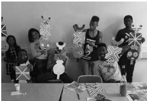
Kinder stellen bei der Afrodiasporischen Samstagsschule selbst Masken her

Gemeinsam werden Strategien entwickelt, um sich trotz alltäglicher, struktureller sowie institutioneller Rassismuswahrnehmungen und -erfahrungen, selbstsicher und bewusst in der Öffentlichkeit bewegen zu können.