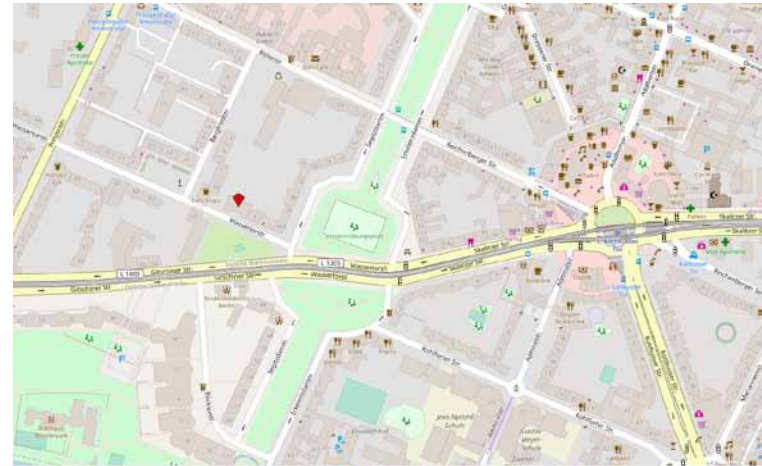
Karte hergestellt aus OpenStreetMap-Daten | Lizenz: Open Database License (ODbL)