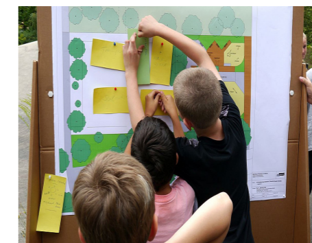
2 Jugendbeteiligung bei der Planungsparty für den Jugendspielplatz in der Theodor-Brusch-Straße in Buch