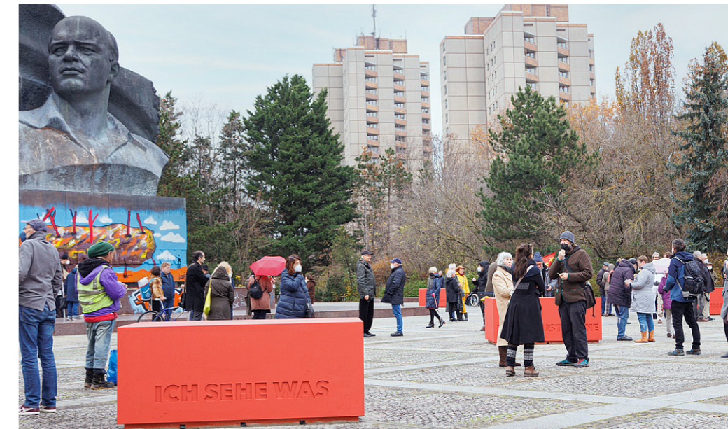
1 Ernst-Thälmann-Denkmal mit künstlerischer Kommentierung am Tag der Enthüllung