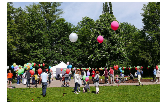
4 Planungsparty zum Tag der Städtebauförderung 2018 im Einsteinpark im Fördergebiet Greifswalder Straße