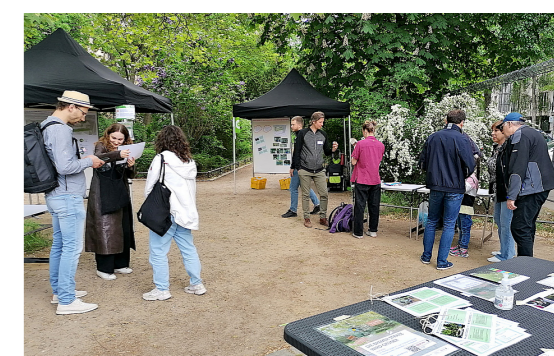
5 Information und Diskussion mit Interessierten bei der Vorstellung der Pläne zur Umgestaltung des Nahraums Bremer Straße im Fördergebiet Tiergarten-Nordring/Heidestraße