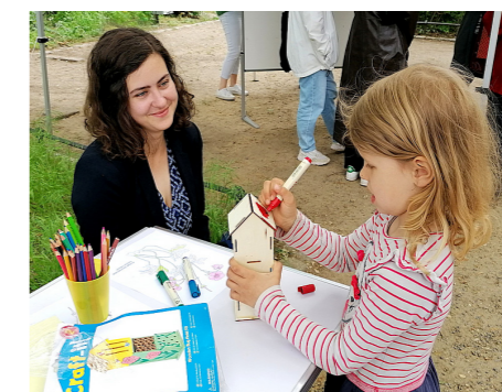
3 Die Bastelaktion am Tag der Städtebauförderung rückte den ökologischen und den pädagogischen Wert von urbanen Grünflächen in den Mittelpunkt (Fördergebiet Tiergarten-Nordring/ Heidestraße)