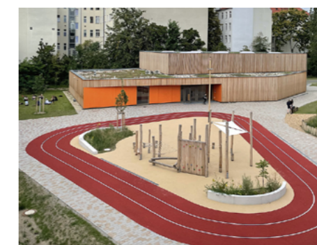
3 Neubau einer Sporthalle für die Johannes-Schule Berlin: Die Einfeldsporthalle wurde wie alle Gebäude des Campus in Holzbauweise errichtet und erhielt eine extensive Dachbegrünung.