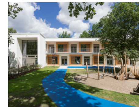
2 Der Neubau der Kita „Regenbogen“ am Senftenberger Ring, 2017 fertiggestellt, besticht durch ansprechende Architektur und hohe Funktionalität. © STARK + STILB ARCHITEKTEN