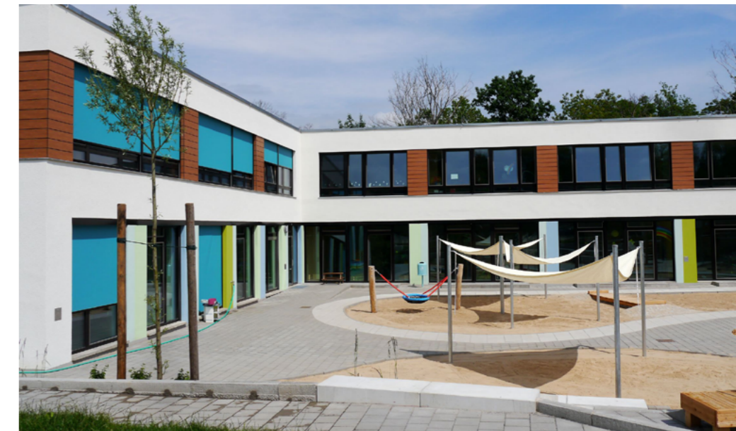
1 Neubau der „Kita Kiesteich-Surfer“: Im Falkenhagener Feld fehlten rund 590 Kita-Plätze. Auf einem Teilstück des Parkplatzes am Spektepark wurde deshalb eine Kita mit 119 Plätzen neu errichtet, davon 40 Krippenplätze für Kinder unter drei Jahren.