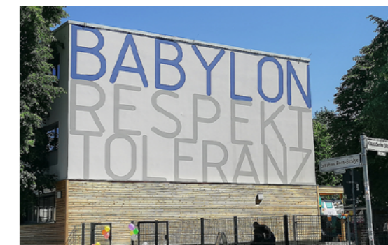
4 Das Haus Babylon ist eine interkulturelle Begegnungsstätte des Trägers Babel e.V. - Name und Motto des Hauses sind nach dem Umbau und der energetischen Sanierung weithin sichtbar.