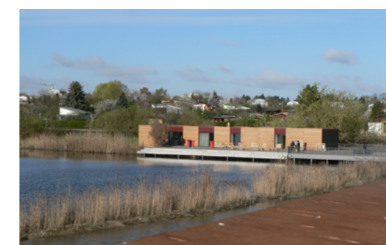
5 2017 ist am Wuhleteich der Neubau eines Umweltbildungszentrums entstanden, das als attraktiver und anregender Bildungsort für Umweltthemen allen Interessierten offen steht.