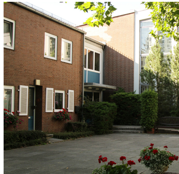
Bestand Zuversichtkirche