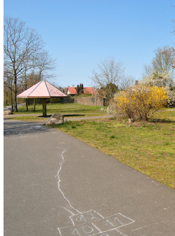
Bestand im Egelpfuhlpark

Im August 2019 wurde das Büro sander.hofrichter planungsgesellschaft mbH in Kooperation mit Freianlage.de Landschaftsarchitektur als Sieger des europaweiten Architekturwettbewerbs zum Neubau des Begegnungszentrums Zuversicht gekürt. Dieses soll mit Räumen für die aktive Gemeindearbeit, einem Stadtteilzentrum, einer Kita und einem Familienzentrum auf dem Kirchenstandort am Brunsbütteler Damm 312 errichtet werden. Damit werden die Flächen für Veranstaltungen, offene Angebote und Gruppenarbeit mit Menschen aus der Nachbarschaft immens erweitert.