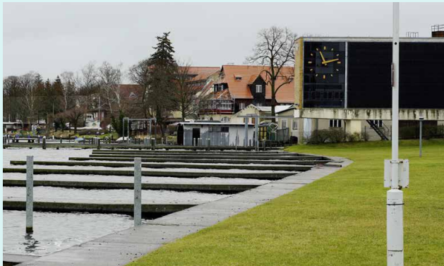
Sportmuseum Berlin, Foto: M. Ganten, Wassersportmuseum Grünau. Foto: C. v. Steffelin