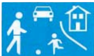
In verkehrsberuhigten Bereichen

Inline-Skates sind keine Fahrzeuge. Sie gehören trotz der mit ihnen erreichbaren Geschwindigkeiten nach der derzeitigen Rechtslage zu den „besonderen Fortbewegungsmitteln“ (§ 24 STVO).