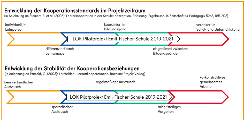
Entwicklung der Kooperationsstandards und -beziehungen.

Zudem führte die WB im Dezember 2019 sowie im Dezember 2020 an der Emil-Fischer-Schule Einzelfallanalysen zur näheren Bestimmung der Gelingensbedingungen der Lernortkooperation durch. Diese basieren auf Dokumentenanalysen und Gesprächen. In der nachfolgenden Auswertung wurden wissenschaftlich-eva-luativ erhobene Befunde mit reflektierten Wahrnehmungen und Erfahrungen der handelnden Akteure in den betroffenen Handlungsfeldern kombiniert.