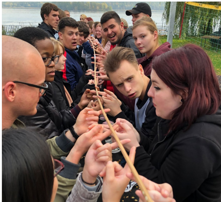
Aktivitäten auf der Klassenfahrt stärken die Teamfähigkeit.

Um die Sozialkompetenzen und die Teamfähigkeit zu stärken, finden je Modellklasse eine Klassenfahrt oder mindestens ein Tagesausflug statt. Voraussetzung dafür ist die Freistellung der Auszubildenden durch die Betriebe. Die Klassenfahrten finden im Haus Kreisau statt und stehen im Zeichen des Teambuilding, was sowohl von den Auszubildenden, Betrieben als auch Lehrer*innen so gewertet wird. Eine hohe Motivation der Auszubildenden, Pünktlichkeit, wenig Fehlzeiten und eine starke Vernetzung der Auszubildenden gerade in der Pandemie in den Modelklassen werden auf diese Maßnahme zurückgeführt.