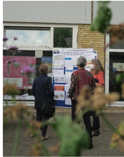
Austausch am Marktstand