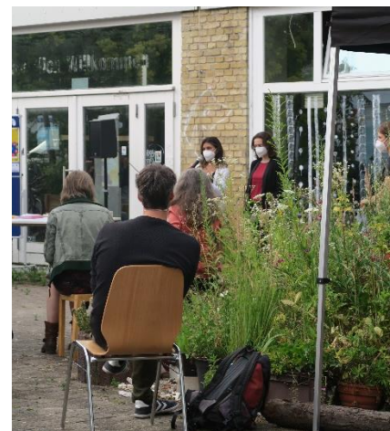
Kurzinput zum energetischen Quartierskonzept durch Megawatt