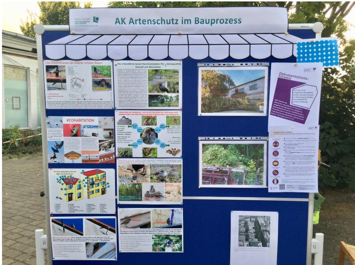
Marktstand 2: AK Artenschutz im Bauprozess (oben), Austausch am Marktstand (rechts)