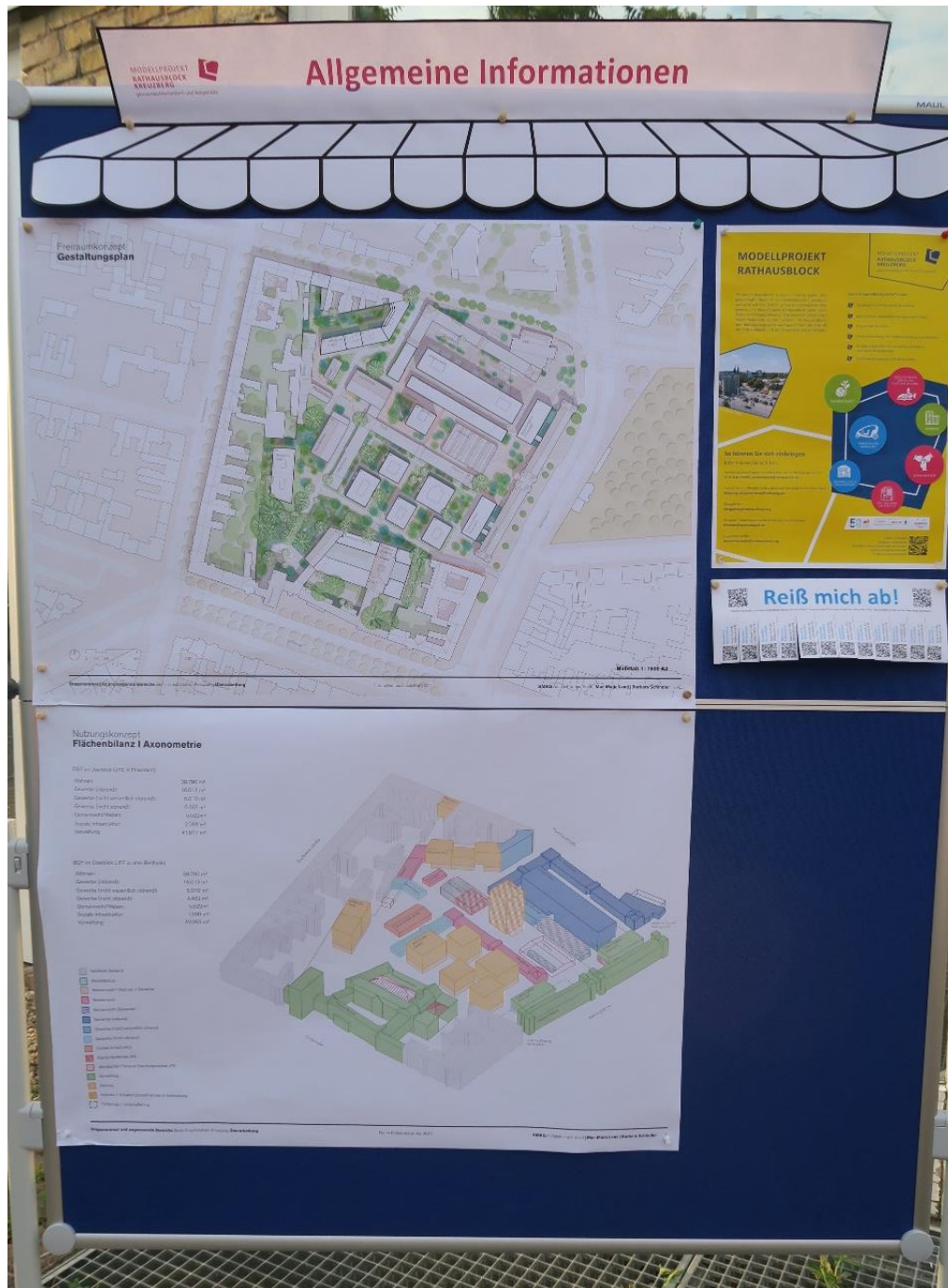
Marktstand 4: Allgemeine Infos