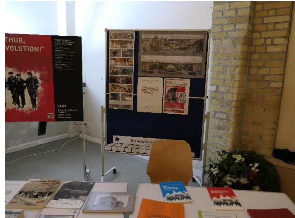
Marktstand „Ein Areal voller Leben“