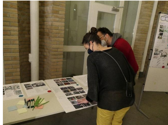
Marktstand zum Gestaltungsleitfaden