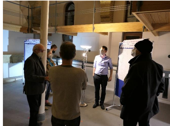
Marktstand zur Machbarkeitsstudie Verkehr