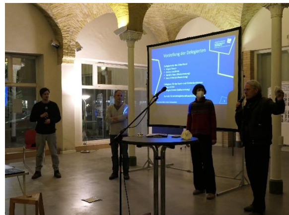
Die Delegierten für das Forum (links) und für das Raum- und Flächenkuratorium (rechts) stellen sich vor