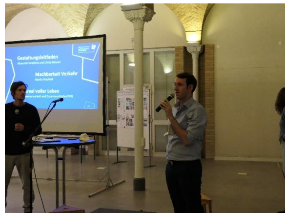
Impressionen aus der Blitzlichtrunde