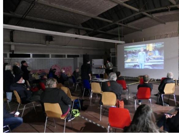
Auszählung der Stimmzetteln durch die Wahlkommission (links) und Impression vom 16. Forum in der Adlerhalle