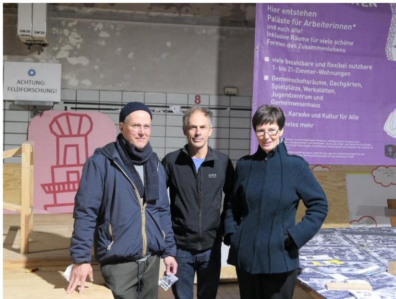
Die gewählten Delegierten des Forums für den Zukunftsrat und das Raum- und Flächenkuratorium ohne Andrea Jaschinski