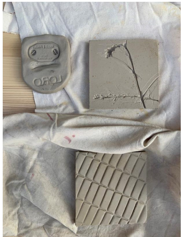
Einige fertige Fliesen, die bereit zum Trocknen sind