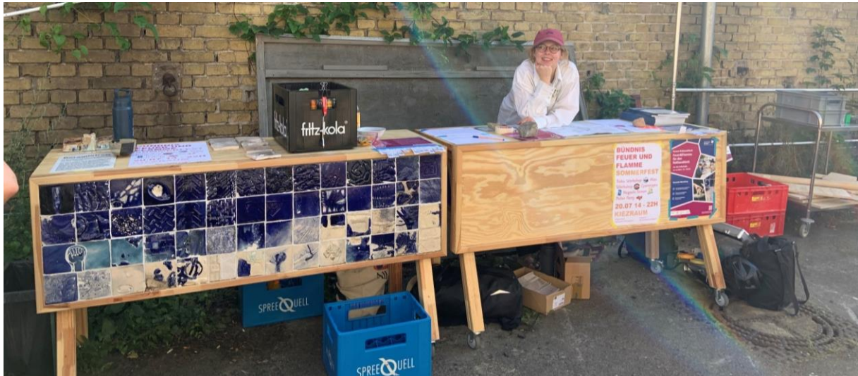
Der Tresen (rechts im Bild) soll ähnlich, wie der daneben gestaltet werden