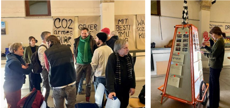
Info-Börse und Ende der Veranstaltung