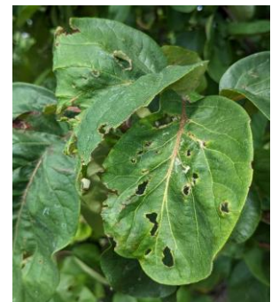
Hagelschaden an Quitte

Nicht alle Löcher in Blättern müssen auf Fraß durch Käfer, diverse Larven oder Schnecken zurückzuführen sein. In der letzten Zeit gab es wiederholt Hagelschauer. Auch wenn sie während Gewittergüssen oft nur wenige Augenblicke dauerten und zunächst oft unbemerkt blieben, so durchlöcherten und zerrisserten sie besonders großflächige Blätter. Hinzukommt, dass das Laub wegen der guten Wassersättigung im Boden in diesem Jahr groß und eher weich ist. Betroffen sind neben Obstgehölzen auch groß- und weichblättrige Stauden.