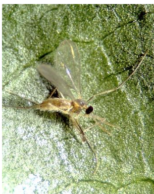
Adulte räuberische Gallmücke