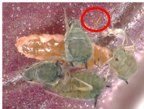
Gallmückenlarve saugend an Blattläusen und Ei (oben)