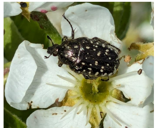
Trauer-Rosenkäfer auf Birnenblüte

Der Käfer ernährt sich ausschließlich von Blütenpollen und die bis zu 30 mm lang werdenden Larven (Engerlinge) von Wurzeln. Auf Grund ihres geringen Schadpotentials werden sie gegenwärtig als nicht pflanzenschädigend eingestuft.