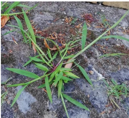
Hirse kurz vor der Blüte