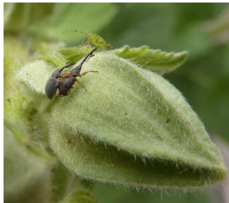
Rüsselkäfer an Stockrosenknospe