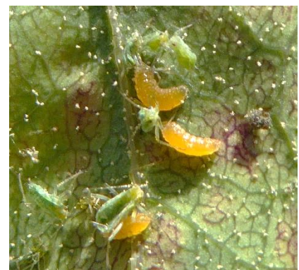
Räuberische Gallmückenlarven in einer Blattlauskolonie

Viele Blattlauskolonien wurden in den letzten Tagen von effektiven Räubern aufgeessen. Auch eine heimische räuberische Gallmücken-Art war daran beteiligt. Die Adulten werden kaum wahrgenommen, sie sind kleiner als bekannte Mücken. Sie legen ihre Eier in die Blattlauskolonien und die schlüpfenden orangefarbenen Larven – bis max. 3 mm lang – saugen die Blattläuse aus. Diese Gallmückenart ist omnipräsent. Im Profigartenbau wird sie zur Blattlausbekämpfung direkt eingesetzt.