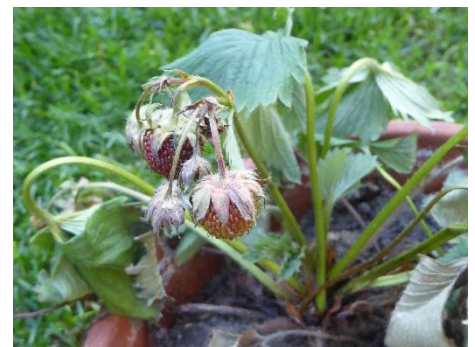
Erdbeerpflanze mit eingetrockneten Früchten durch Wurzelfäule absterbend