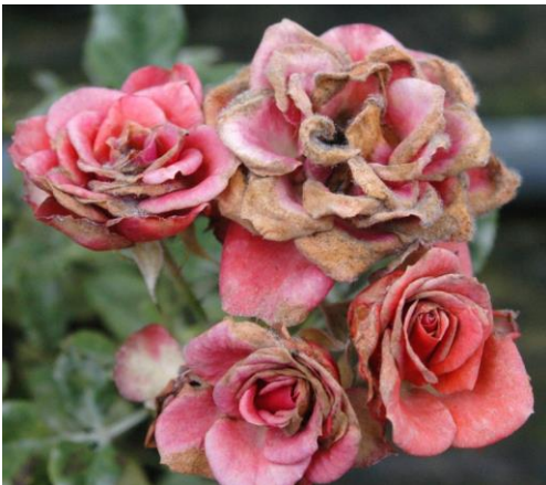
Echter Mehltau an Blütenblättern

Der Pilz tritt an flachgründigen und feuchtwarmen Standorten mit starken Temperaturschwankungen auf. Hohe Tag- und niedrige Nachttemperaturen mit Taubildung wirken sich förderlich auf die Entwicklung des Pilzes aus. Auf Grund seiner Vorliebe für Trockenheit und Wärme wird der Echte Mehltau auch als Schönwetterpilz bezeichnet. Die Sporen werden mit Hilfe von Regen und Wind verbreitet und haben eine optimale Keimtemperatur zwischen 20 und 25°C. Dauerregen jedoch kann die Sporen abtöten. Eine Überwinterung kann nur auf lebendem Pflanzengewebe und in den Trieben und Knospen erfolgen.