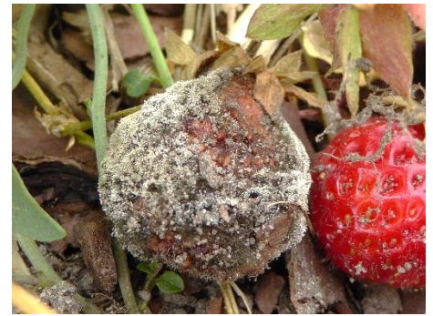
Vom Grauschimmelpilz geschädigte Erdbeerfrucht

Runde Fraßstellen können von Schnecken herrühren. Aber auch der Getüpfelte Tausendfuß befällt die Früchte. Er vermehrt sich besonders gut bei reichlicher Zufuhr organischer Stoffe wie Stallmist oder Kompost. Die Tausendfüßer können mit ausgelegten Möhren- oder Kartoffelscheiben weggefangen werden.