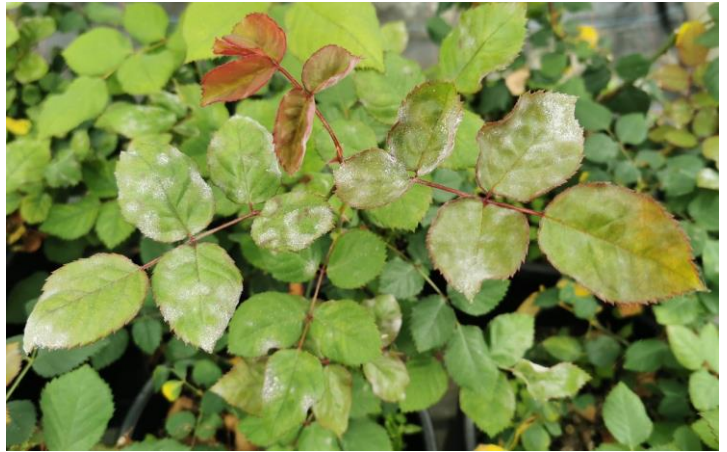
Weißer Pilzbelag auf Rosenblättern

Echter Mehltau bildet einen weißen, später gräulich werdenden, abwischbaren Belag auf der Blattoberseite. Später auch auf den Trieben, Knospen und der Blattunterseite. An den jungen Pflanzenteilen kann es zudem zu Wachstumsstörungen und Deformationen sowie im weiteren Verlauf zu einem nach unten Einrollen und Vertrocknen der Blätter kommen. Ein Befall führt jedoch nur in seltenen Fällen zu einem Blattfall. Besonders junges und weiches Pflanzengewebe wird vorzugsweise befallen.