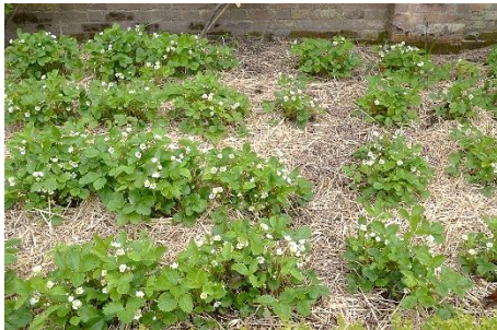
Mit Stroh den Befall an Schadorganismen in Erdbeerpflanzungen mindern

Niederschläge, Taubildung und hohe Luftfeuchte in dichten Beständen beim jetzigen Temperaturverlauf fördern den Befall durch Grauschimmel an unreifen und heranreifenden Früchten. Die Früchte werden braun, weich und später kann sich darauf ein grauer Filz bilden: „Grauschimmelpilz“. Bei Gefahr muss für eine sehr gute Belüftung und schnelles Abtrocknen des Pflanzenbestandes gesorgt werden. Auf zusätzlichen Pflanzenbewuchs wie z.B. Kräuter ist zu verzichten.