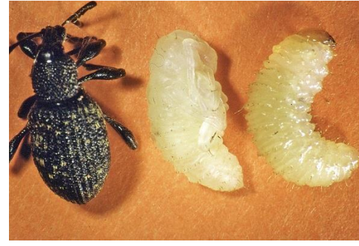
Abb. 5: Käfer, Puppe, ausgewachsene Käferlarve