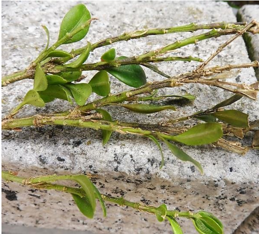
Abb. 10: Läsionen am Trieb