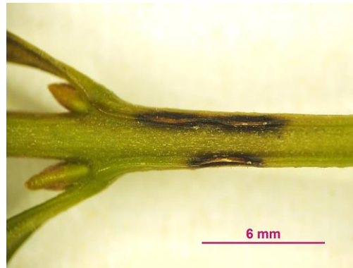
Abb. 11: Läsionen im Detail