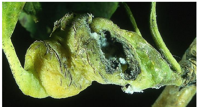
Abb. 16: offene, leere Galle

Im Frühsommer, wenn sich die Blätter und Blattstiele noch im Wachstum befinden, ist der Blattstiel spiralförmig gedreht (Abb. 17). Im weiteren Verlauf entsteht daraus eine zunächst grüne Galle (Abb. 18).