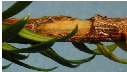
Abb. 6: Käferfraß Trieb, Taxus