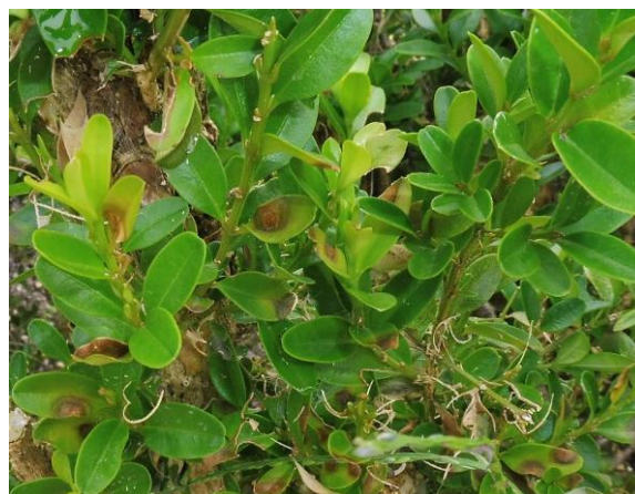
Abb. 9: Bildung von Blattflecken

Die Bedingungen für eine Infektion mit dem pilzlichen Erreger des Buchsbaumtriebsterbens waren in den letzten beiden Wochen mit Temperaturen über 24 °C und einer ausreichenden Blattfeuchtigkeit (min. 5 Stunden) sehr gut. Die Sporen keimen auf dem Blattgewebe aus und der Pilz wächst direkt in das gesunde Pflanzengewebe hinein. In der Folge erscheinen nach ca. einer Woche erste Blattflecken (Abb. 9). Anschließend setzt Blattfall ein. Auf den Trieben erkrankter Pflanzen sind schwarze Striche, sog. Läsionen (Abb. 10 u. Abb. 11) sichtbar, die als sicheres Erkennungsmerkmal gelten.