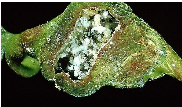
Abb. 15: aufgeplatzte Galle mit Wachswolle

Grauweiße Beläge auf Autos und Flächen unter und in der Nähe von Pappeln führen zu Anfragen u.a. bei den Umweltämtern, ob es sich dabei um gesundheitsschädigende Schadstoffe handelt. Bei diesen Belägen handelt es sich jedoch nur um die Wachswolle der Späten Pappelblattdrehstiellaus ( Pemphigus spyrothecae ). Beim Aufplatzen der Galle (Abb. 15) im Spätsommer gelangen nicht nur die Läuse ins Freie, sondern eben auch diese Wachswolle, die dann überall in der Umgebung als Belag zu finden ist.