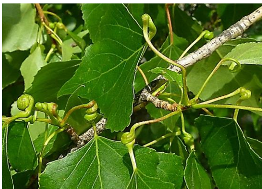
Abb. 17: Gallen Anfang Mai

Im Frühsommer, wenn sich die Blätter und Blattstiele noch im Wachstum befinden, ist der Blattstiel spiralförmig gedreht (Abb. 17). Im weiteren Verlauf entsteht daraus eine zunächst grüne Galle (Abb. 18).