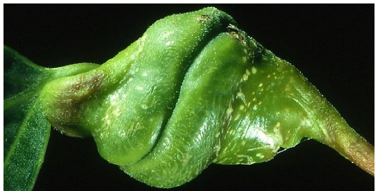
Abb. 18: Spiralgalle am Blattstiel