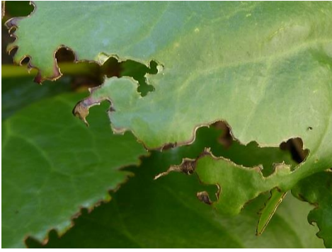
Abb. 3: Blattfraß des Käfers, Bergenie