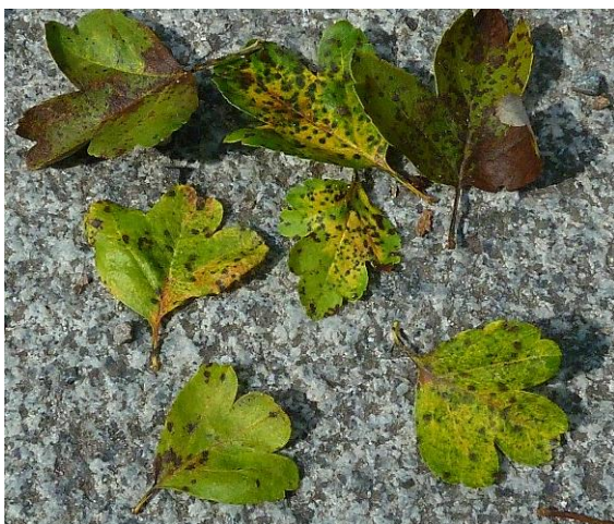
Abb. 13: Blatflecken durch Entomosporium mespili

Empfehlungen: Grundsätzlich gilt, dass bei allen Arbeiten in erkrankten Buchsbaumbeständen Hygienemaßnahmen (Entsorgung des erkrankten Pflanzenmaterials, Desinfektion der Schneidewerkzeuge, Beseitigung des Falllaubes etc.) zu beachten sind, um eine weitere Ausbreitung zu behindern und um den Infektionsdruck auf die noch nicht erkrankten Bereiche zu mindern. Die Anwendung von Pflanzenschutzmitteln (Fungizide) kann die Erkrankung nicht heilen, sondern nur die weitere Ausbreitung erschweren. Behandlungen sind immer Einzelfallentscheidungen, die nach Fläche und Befallsgrad unterschiedlich bewertet werden. Dazu bitte unsere Beratung in Anspruch nehmen.