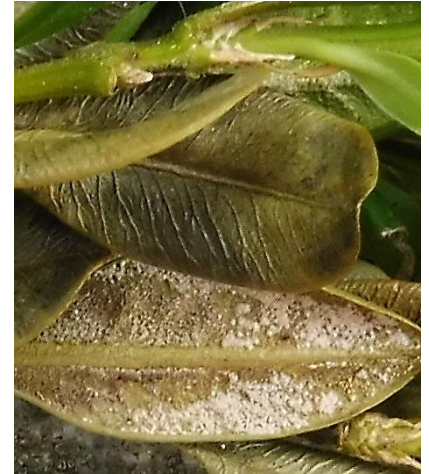
Abb. 12: Sporenlager, Blattunterseite

Bei ausreichender Luftfeuchtigkeit erscheinen auf der Blattunterseite weiße Pilzsporen (Abb. 12), die für eine schnelle Weiterverbreitung sorgen. Durch Schnittmaßnahmen, Wasserspritzer etc. werden die Sporen schnell verbreitet. Neben den Sporen bildet der Pilz auch langlebige Dauersporen aus, die auf abgefallenen Blättern im Boden für min. 4 Jahre überdauern können.