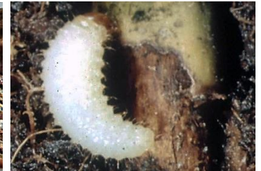
Abb. 8: Larvenfraß Wurzelhals