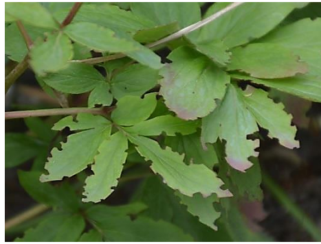
Abb. 4: Blattfraß des Käfers, Elfenblume