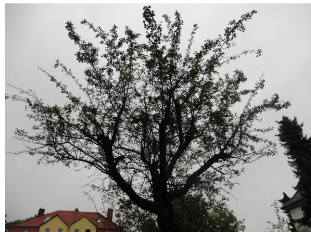
Abb. 14: verkahlter Rotdorn