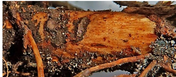
Abb. 7: Larvenfraß Wurzel