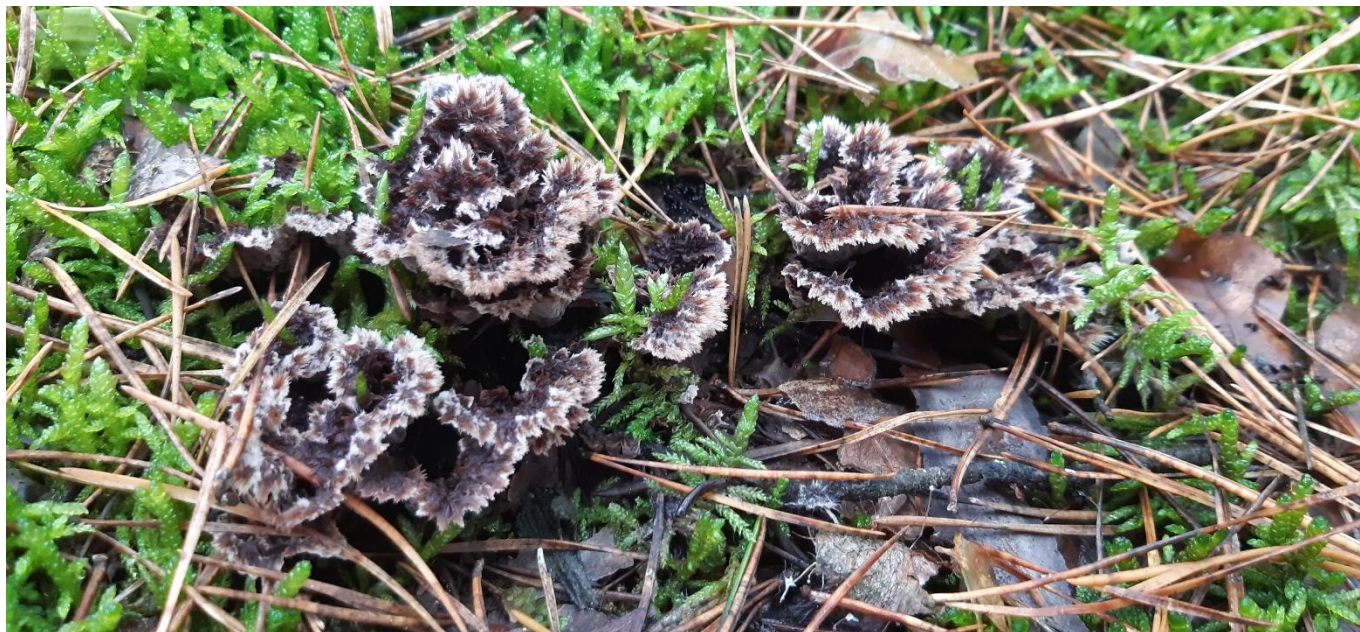
Abb. 19: Fruchtkörper des Erdwarzenpilzes

Die Niederschläge der vergangenen Wochen haben auch das Fruktifizieren diverser Pilze gefördert. Neben zahlreichen Tintlingen und Schwefelköpfen am Stammfuß von Gehölzen treten auch sog. Warzenpilze Thelephora sp. im Baumumfeld (Rasen, Streu) verstärkt auf. Letztere ernähren sich von abgestorbenen Pflanzenresten (Abb. 19) und haben für Bäume keine schädigende Wirkung.