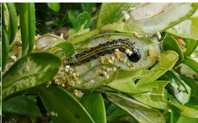
Abb. 2: Fraß, abgeschabte Blätter und Raupenkot als Symptome