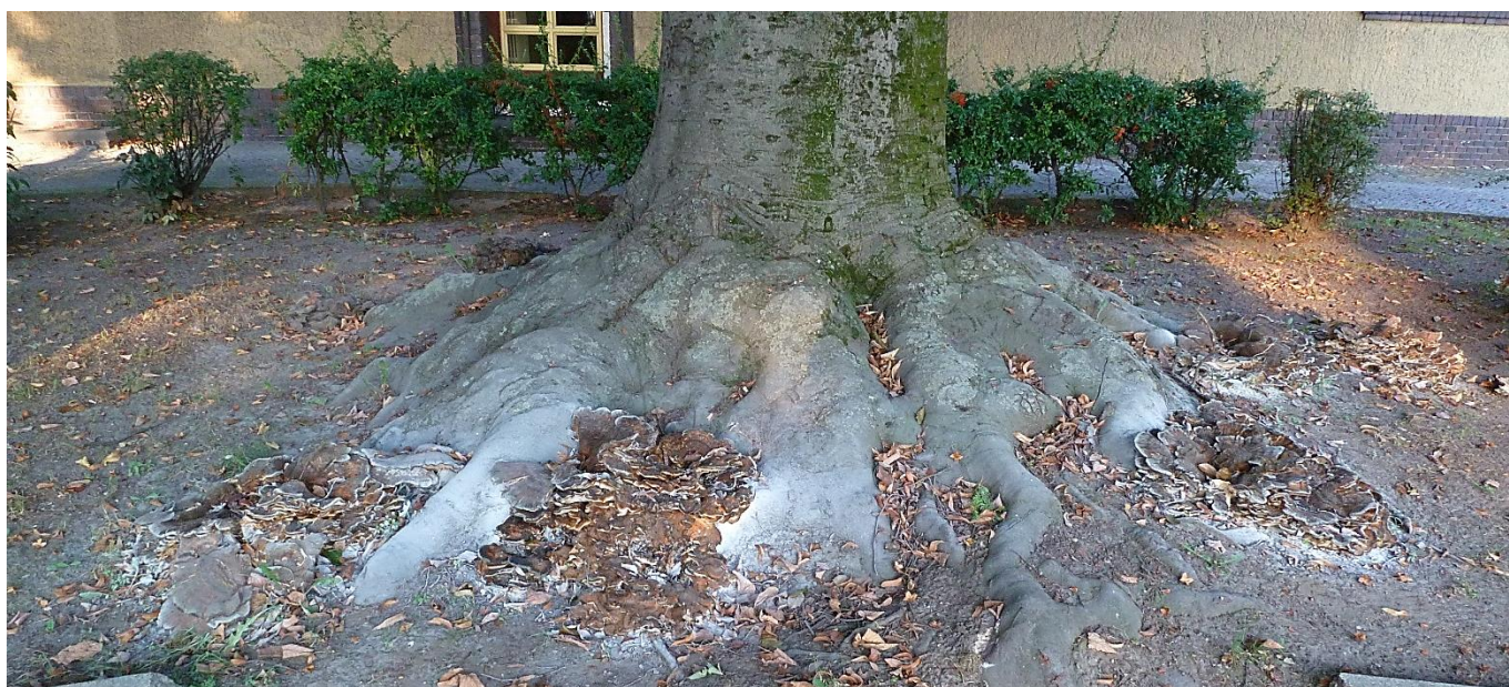
Abb. 20: Fruchtkörper des Riesenporlings mit starker Sporulierung am Wurzelteller einer Rotbuche

Ganz im Gegensatz zum Riesenporling ( Meripilus giganteus ), der aktuell ebenfalls fruktifiziert (Abb. 20). Vorwiegend an Rotbuchen vorkommend parasitiert dieser holzerstörende Pilz die Wurzeln seiner Wirte und kann somit deren Standsicherheit beeinträchtigen. Ausführliche Informationen zum Riesenporling entnehmen Sie bitte dem entsprechenden Steckbrief auf unserer Webseite .