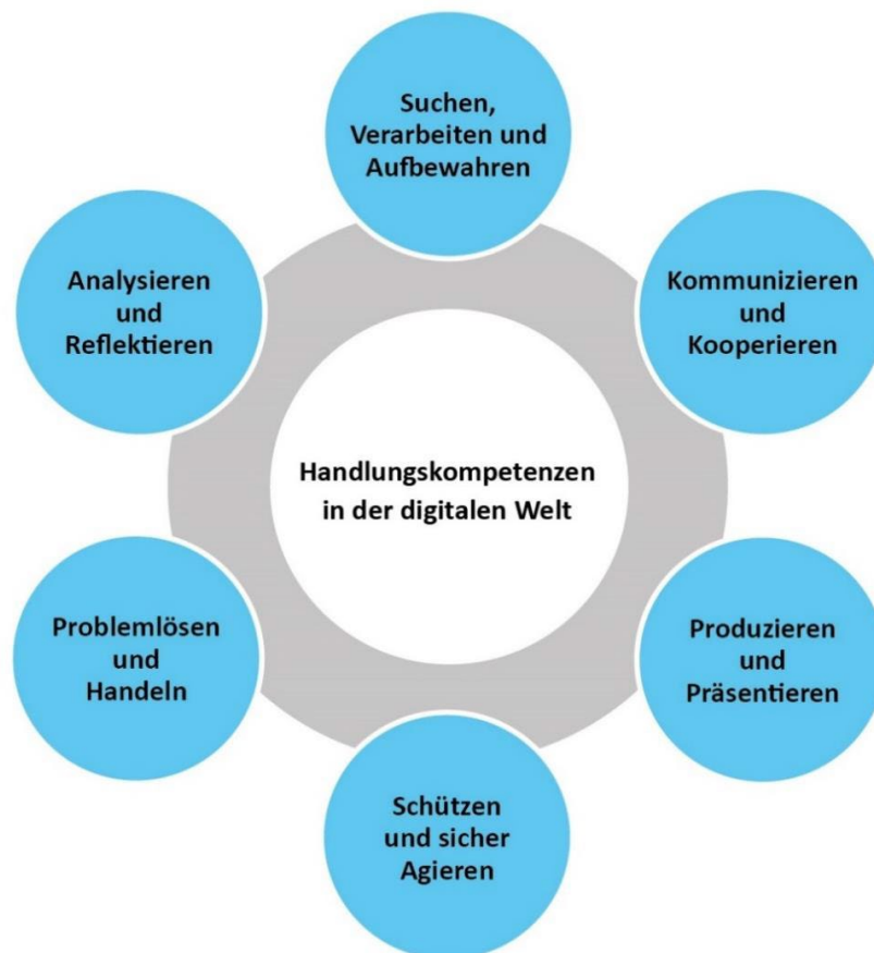
Abbildung 2: Handlungskompetenzen in der digitalen Welt

Die beruflichen Schulen knüpfen in ihren Bildungsprozessen an das Alltagswissen der Schülerinnen und Schüler und an die Kompetenzen an, die sie an allgemeinbildenden Schulen im Umgang mit digitalen Medien erworben haben. Es ist eine Querschnittsaufgabe des fachlichen und überfachlichen Lernens in der beruflichen Bildung, dass diese Handlungskompetenzen in der digitalen Welt erworben und weiterentwickelt werden. Maßgebend ist hierbei der Kompetenzrahmen der Strategie der Kultusministerkonferenz (KMK) zur Bildung in der digitalen Welt, der insgesamt sechs digital konnotierte Kompetenzbereiche für alle Schulformen beschreibt: 9