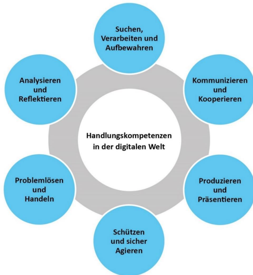
Abbildung 2: Kompetenzen in der digitalen Welt

Die beruflichen Schulen knüpfen in ihren Bildungsprozessen an das Alltagswissen und die Kompetenzen an, die die Schülerinnen und Schüler im Umgang mit digitalen Medien an allgemeinbildenden Schulen erworbenen haben. Sich Handlungskompetenzen in der digitalen Welt anzueignen und diese weiterzuentwickeln sind eine Querschnittsaufgabe des fachlichen und überfachlichen Lernens in der beruflichen Bildung. Der Kompetenzrahmen der Strategie der Kultusministerkonferenz „Bildung in der digitalen Welt“ beschreibt sechs Kompetenzbereiche, die dem Bildungsauftrag der Schule in der digitalen Welt Rechnung tragen: 9