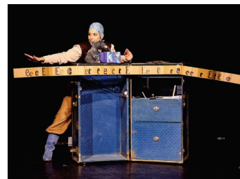
POP UP, PIRATI! - Pliegues fantásticos y deslumbrantes tesoros lingüísticos

b) Las salas de teatro infantil y juvenil de Pankow pueden solicitar la financiación de proyectos, p. ej. para una nueva producción. Además, pueden financiarse proyectos de cooperación de artistas y otras instituciones en Pankow, con el fin de crear nuevas estructuras descentralizadas y sinergias en el ámbito del teatro infantil, juvenil y de marionetas.