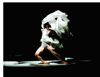
ELEKTRO KAGURA | G8.000.000

Se financian proyectos individuales actuales que se presenten públicamente en Pankow. Estos proyectos deben contribuir a la diversidad y vitalidad de la vida cultural en el distrito, p. ej. una exposición, una lectura, un concierto, una performance, una producción teatral. También se admiten proyectos multidisciplinares, pero no proyectos del ámbito de la educación cultural.