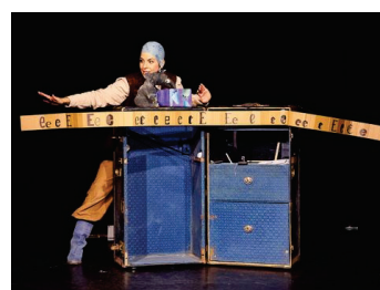
ВЫЛЕЗАЙ, ПИРАТ! – Фантастические склады и ослепительные языковые сокровища

Программа KiA („перформативные искусства для юной публики“) поддерживает создание и проведение театральных выступлений для детей и подростков в двенадцати районах Берлина. Подача заявки на получение государственных дотаций для различных целей возможна и в районе Панков: