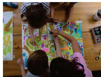
Арт-проект: Буря и пляж

Этот фонд предоставляет средства на проекты с активным участием детей, подростков и молодежи до 27 лет. Поддержку могут получить исключительно совместные проекты культурных учреждений / свободных деятелей искусства (= культурных партнеров) вместе с детскими садами / школами / центрами досуга и другими заведениями района Панков (образовательными партнерами), например, проектная неделя в школе, арт-проект в детском саду, мастер-класс в центре досуга для подростков.