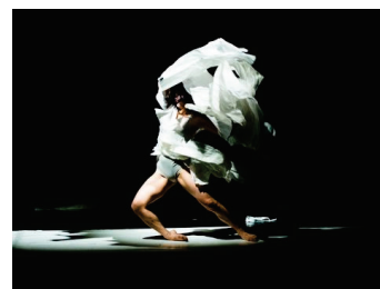
ELEKTRO KAGURA | G8.000.000

Поддержка предоставляется актуальным проектам с последующей публичной презентацией в районе Панков. Проекты, получившие финансовую поддержку - выставка, литературное чтение, концерт, перформанс, театральная постановка - вносят свой вклад в живое многообразие культурной жизни района. В этой категории рассматриваются и междисциплинарные проекты кроме проектов из области культурного образования.