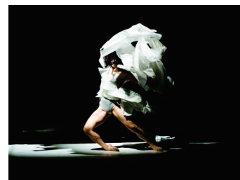
ELEKTRO KAGURA | G8.000.000

Dofinansowane są aktualne pojedyncze projekty, które będą publicznie prezentowane w dzielnicy Pankow. Ich celem jest zróżnicowanie i ożywienie życia kulturalnego w okręgu, np. wystawa, odczyt, koncert, występ, spektakl teatralny. Uwzględniane są również projekty interdyscyplinarne, pod uwagę nie są jednak brane żadne projekty z zakresu edukacji kulturalnej.