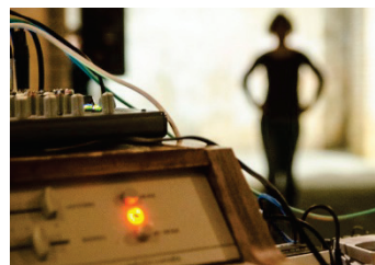
Zdjęcie: Alexander Meurer bohemian.drips | Speicher

Ten program dofinansowania jest skierowany do niezależnych instytucji kulturalnych w Pankow, które nie otrzymują strukturalnego wsparcia (np. z administracji senatu ds. kultury i Europy). Można złożyć wniosek o dofinansowanie zakupu technicznej i ruchomej infrastruktury, np. instalacji oświetleniowej i dźwiękowej lub nowych krzesel. Dofinansowane są także niewielkie szkolenia i konsultacje organizacyjne, o ile służą one optymalizacji pracy w instytucji, np. warsztaty dot. pracy publicznej.