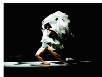
ELEKTRO KAGURA | G8.000.000

Vengono finanziati i singoli progetti in corso che vengono presentati al pubblico a Pankow. Hanno come obiettivo quello di contribuire alla diversità e alla vitalità della vita culturale del distretto, ad esempio una mostra, una lettura, un concerto, uno spettacolo, una produzione teatrale. Vengono presi in considerazione anche progetti interdisciplinari, ma non progetti nel campo dell'educazione culturale.