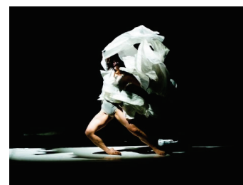
ELEKTRO KAGURA | G8.000.000

Les projets subventionnés sont des projets individuels et actuels, qui sont présentés publiquement à Pankow. Ils doivent contribuer à la diversité et à la vivacité de la vie culturelle de l'arrondissement. Il peut s'agir par exemple d'une exposition, d'une lecture, d'un concert, d'une performance ou encore d'une production théâtrale. Les projets interdisciplinaires sont également pris en compte, mais pas de projets dans la domaine de la formation culturelle.