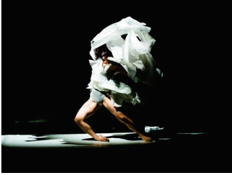
ELEKTRO KAGURA | G8.000.000

يُتاح التمويل للمشاريع الفردية الحالية التي يتم تقديمها للجمهور في مدينة بانكوف. ويجب أن تساهم المشروعات في تنوع وحيوية الحياة الثقافية في المنطقة، على سبيل المثال معرض، قراءة، حفلة موسيقية، استعراض، إنتاج مسرحي. كما يتم النظر في مشاريع متعددة التخصصات، ولكن لا يتم النظر في مشاريع تابعة لمجال التعليم الثقافي.