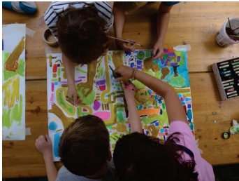
مشروع في: العاصفة والشاطئ

يوفر هذا الصندوق الأموال للمشاريع بمشاركة نشطة من الأطفال والمراهقين والشباب حتى سن 27. ويقتصر التمويل على مشاريع التعاون للمؤسسات الثقافية/الفنانين المستقلين (= الشركاء الثقافيين) جنباً إلى جنب مع مراكز الرعاية النهارية/المدارس/المرافق الترفيهية في مدينة بانكوف وما إلى ذلك (شركاء التعليم)، على سبيل المثال أسبوع مشروع في المدرسة، مشروع فني في مركز الرعاية النهارية، ورشة عمل في مرفق ترفيهي للشباب.