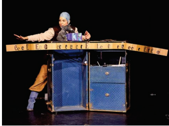
الطافية، الفرسان! - مهارات رائعة وكنوز لغوية مبهرة

يوفر برنامج Kia التمويل المطلوب لإنشاء وتنفيذ عروض مسرحية للأطفال والشباب في اثنتي عشرة بلدية في برلين. يمكن أيضًا تقديم طلب التمويل لأغراض مختلفة في مدينة بانكوف: