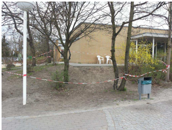
Bestand Anfang Oktober 2013

Finanziert aus Sanierungsmitteln und Mitteln des Fördervereins, konnten im Oktober 2013 unter Beteiligung der Kinder am Bau die Sanierung und Neugestaltung des Hanges mit Baumhaus und Rutsche, Hangelseil und Sitzbank an der Mensa realisiert werden.