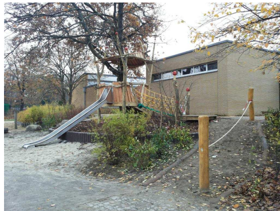
BA 1: Hangsanierung und Baumhaus 10/2013