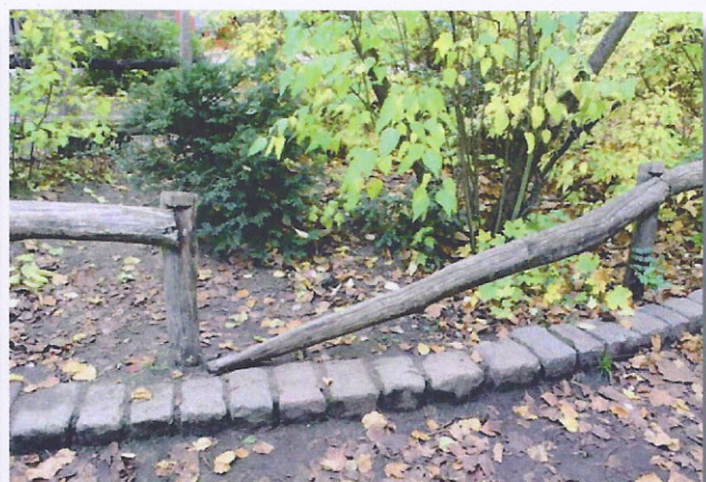
Zäune in Auflösung