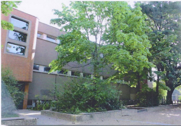
Großbäume in Hochbeeten