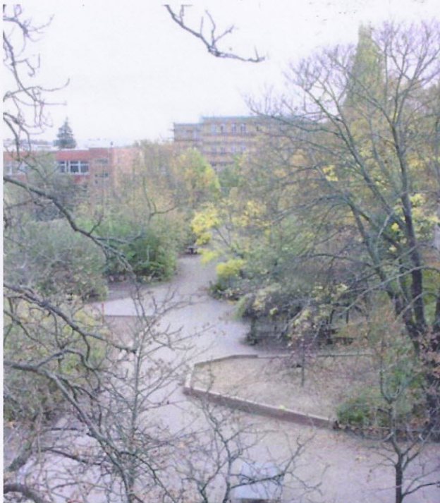
Großer Spielhof - Kletterspinne IDEEN- UND REALISIERUNGSWETTBEWERB 2013