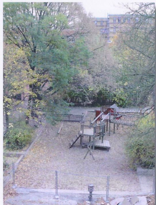
Großer Spielhof - Spielkombination