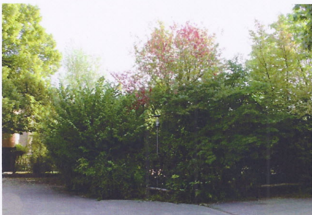
Ausleuchtung / Gehölzschnitt