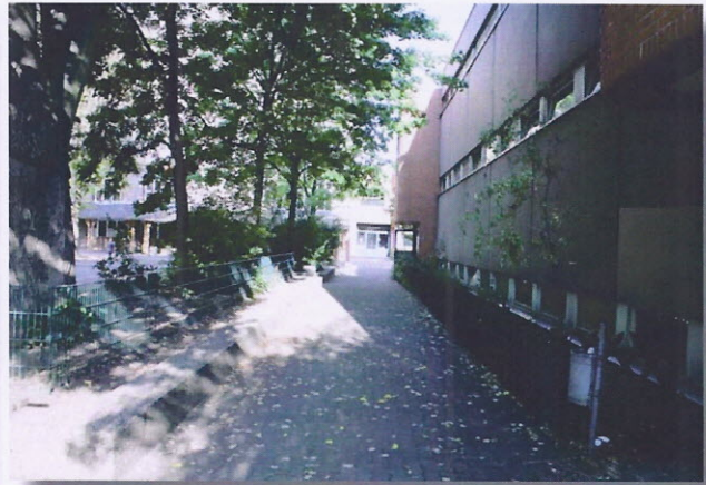
Zugang zur Turnhalle