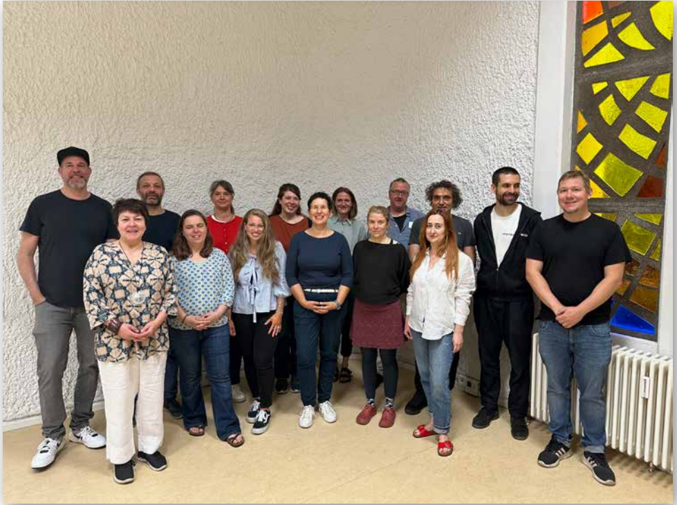
Die Vorbereitungsgruppe der Väterwochen Oktober 2024