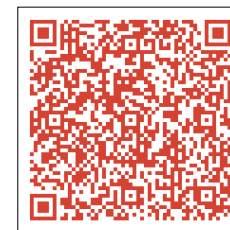
Kat-L und Kat-I Standorte

Zusätzlich zu den notstromversorgten Katastrophenschutz-Leuchttürmen (Kat-L) des Bezirksamtes werden im Ernstfall an weiteren Standorten Katastrophenschutz-Informationspunkte (Kat-I) eingerichtet, die ehrenamtlich betreut werden und vom Katastrophenschutz regelmäßig mit aktuellen Informationen versorgt werden. Eine Übersicht aller Standorte erhalten Sie im Internet.