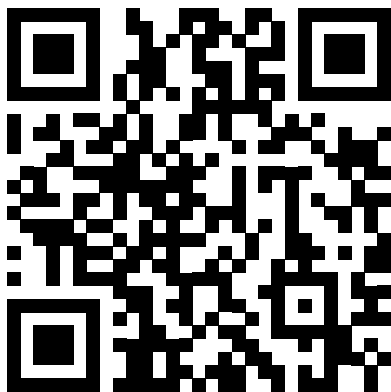
Tagesaktuelles Programm inklusive Ferienprogramm