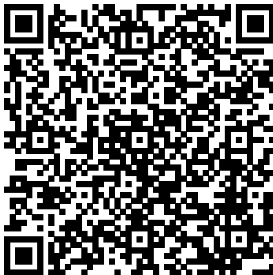
Kinder- und Jugendfreizeiteinrichtungen