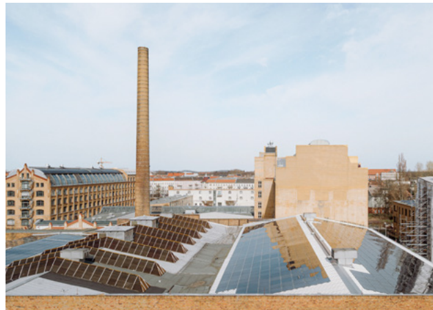
Abb. 5: PV-Anlagen auf denkmalgeschützten ehemaligen Fabrikgebäuden

Insbesondere für Industrie- und Technikdenkmale wie Fabrik- und Produktionsgebäude, Kraftwerke oder Verkehrsbauwerke sind technische Elemente und reflektierende Oberflächen vielfach typische Gestaltungsthemen. Standardsolaranlagen können platziert werden, wenn sie sich in die technische Anmutung des Gebäudes einfügen.