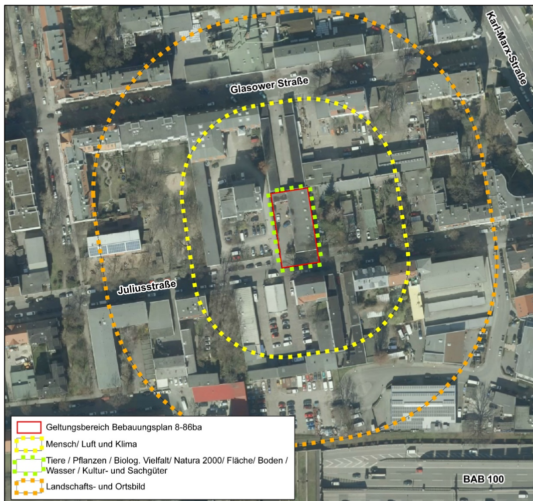
Abbildung 2: Schutzgutspezifische Untersuchungsräume für die Umweltprüfung zum Bebauungsplan Nr. 8-86ba (Fugmann Janotta und Partner mbB)

Der größte Untersuchungsraum mit einem Radius von 100 m wurde für das Schutzgut Landschafts- und Ortsbild bemessen. Hierdurch werden alle Standorte im Umfeld in die Betrachtung einbezogen, von denen aus das Plangebiet noch mehr oder weniger einsehbar und damit Veränderungen wahrnehmbar sind. Des Weiteren werden in diesem Radius die charakteristischen Strukturtypen des Ortsbildes bewertet. Somit können Veränderungen im Plangebiet beurteilt werden, die in diesem Zusammenhang besonders wahrnehmbar wären.