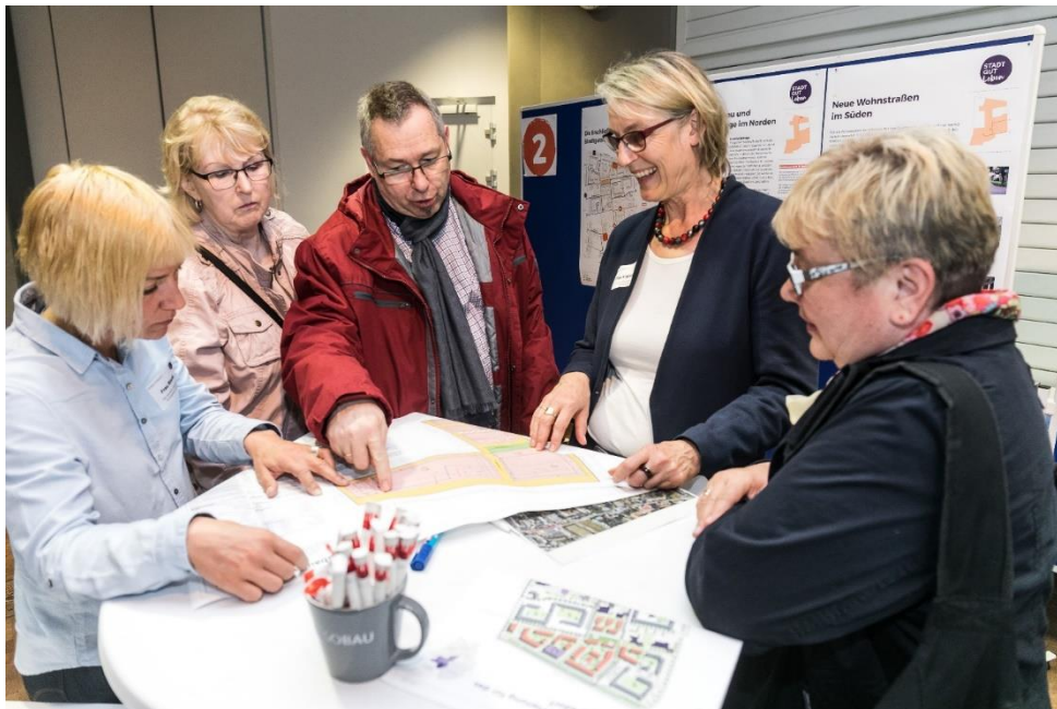
Abbildung 6: Diskussion am Thementisch (öffentliche) Räume gestalten