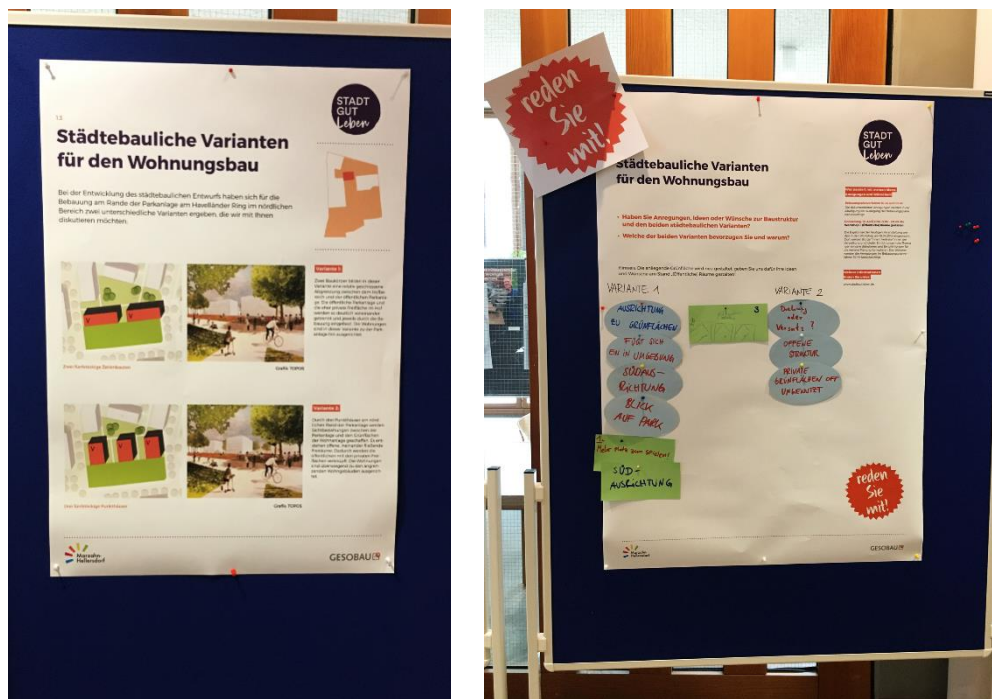
Abbildung 2: Städtebauliche Varianten für den Wohnungsbau

Zwei Teilnehmende haben eine Drehung der Gebäudestellung in Variante 2 angeregt, um die Strukturen aufzulockern.