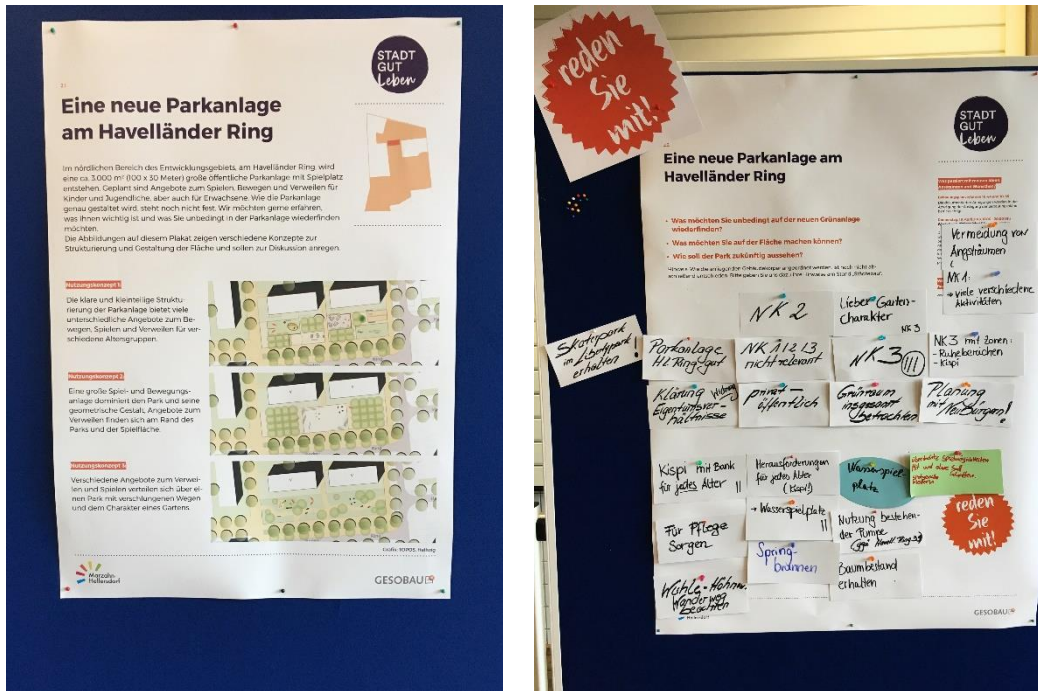
Abbildung 4: Parkanlage am Havelländer Ring