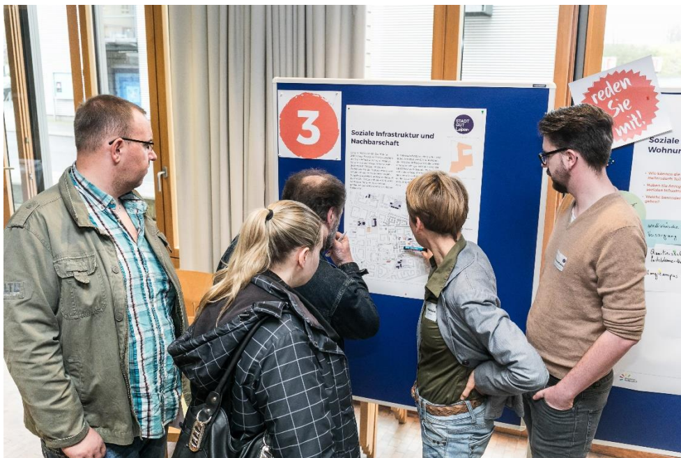
Abbildung 8: Diskussion am Thementisch Nachbarschaft gestalten