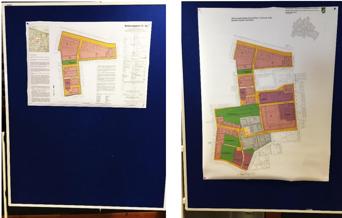
Abbildung 1: Entwürfe der Bebauungspläne 10-44 einzeln (links) sowie 10-44 und 10-45 zusammen (rechts)

Im Rahmen der öffentlichen Auslegung des B-Plans 10-44 für den nördlichen Bereich des Entwicklungsvorhabens fand am 14.04.2018 eine mehrstündige Informationsveranstaltung statt, zu der Anwohnende sowie Interessierte eingeladen waren. Mitarbeitende des Bezirksamtes Marzahn-Hellersdorf sowie der GESOBAU AG erläuterten den ausliegenden B-Plan sowie die Planungen im Rahmen des Entwicklungsvorhabens. Die verschiedenen Aspekte der Planungen waren an Thementischen gruppiert und wurden während der Veranstaltung von Mitarbeitenden der raumplaner moderiert. Während der Veranstaltung wurden Einwendungen und Anregungen aufgenommen sowie verschiedene Themen offen diskutiert. Die Ergebnisse der Diskussionen gehen ebenfalls in die Abwägungen sowohl zum B-Plan 10-44 wie auch dem B-Plan 10-45 ein.