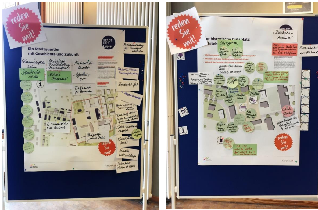
Abbildung 9: Historisches Stadtgut und Gutsplatz