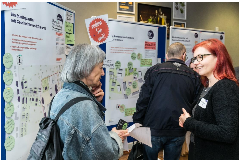
Abbildung 10: Diskussion am Thementisch Gut leben