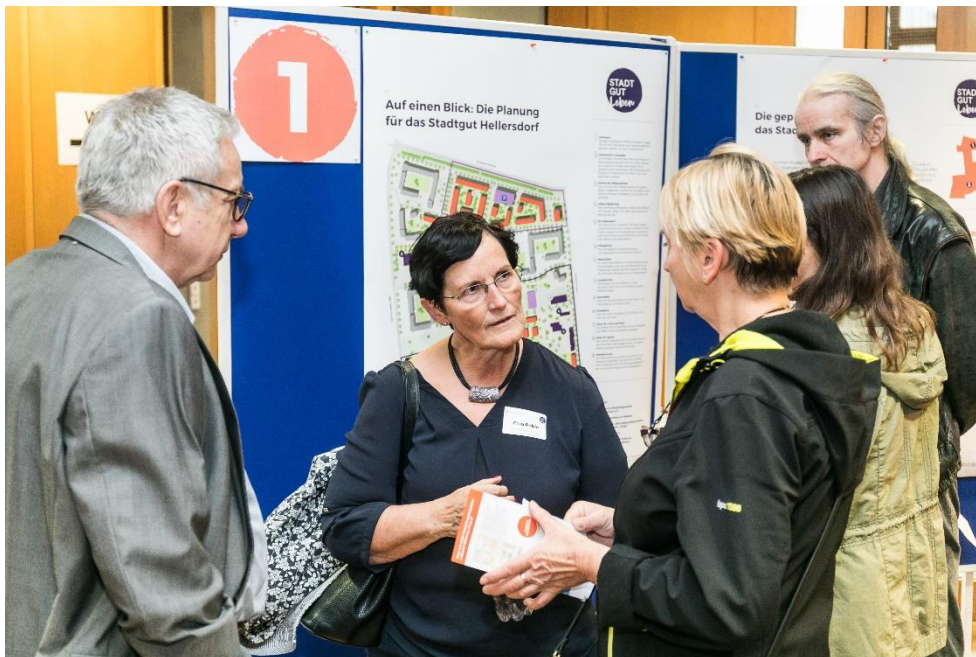
Abbildung 3: Diskussion am Thementisch Planungsprozess und Städtebau