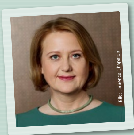
Lisa Paus , Bundesministerin für Familie, Senioren, Frauen und Jugend