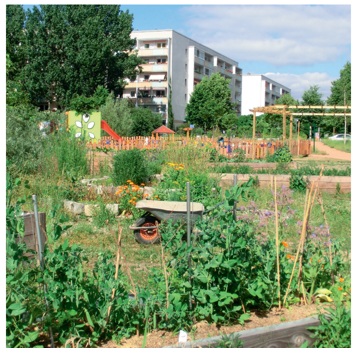
Bürgergarten Helle Oase