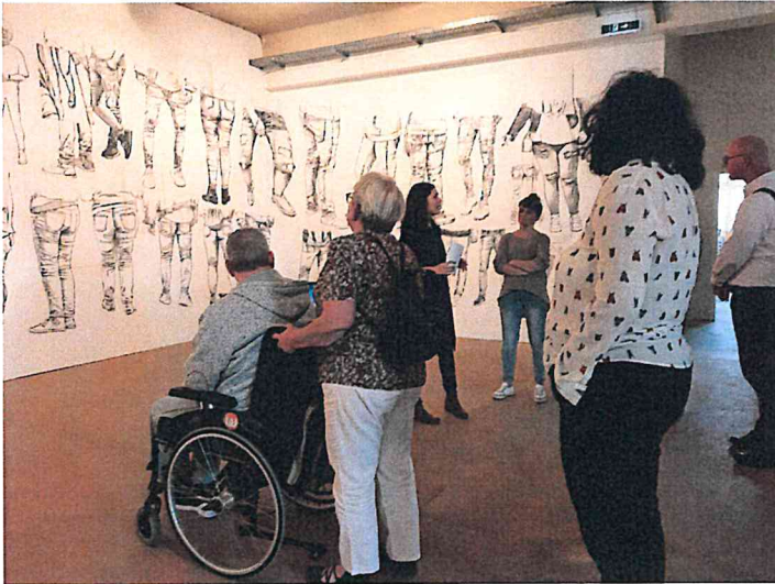
Freitag in der Ausstellung „Und Schwester Makart geht auf Wanderschaft“ im Künstlerhaus Margareten 1050