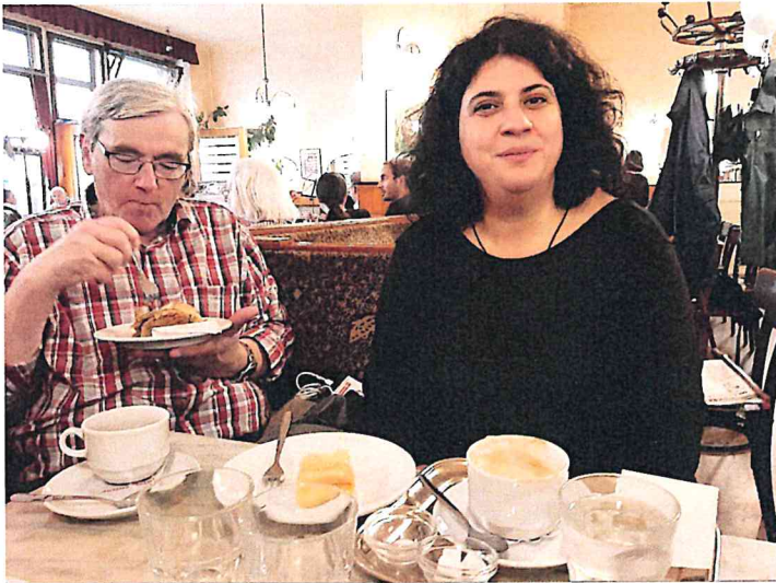
Im Cafe Bräunerhof