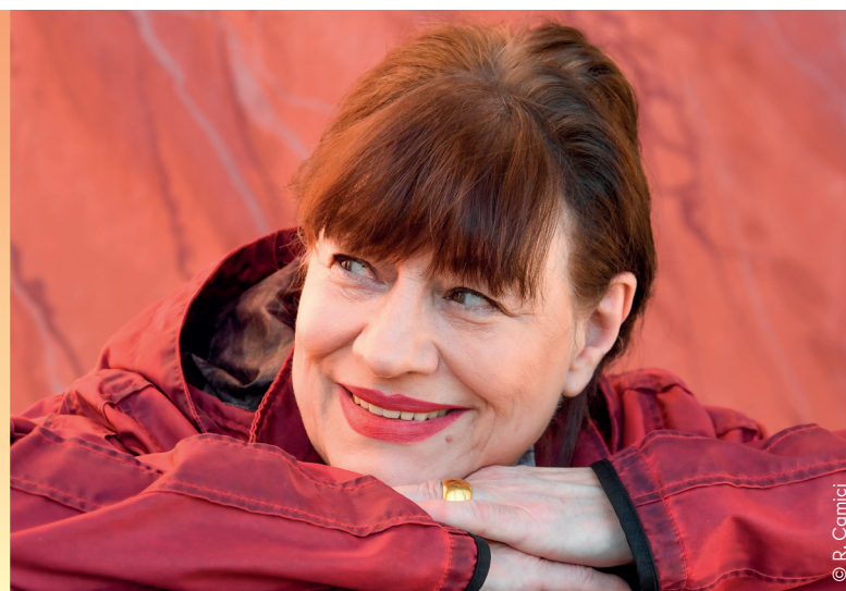
Ulla Meinecke Dienstag, 19.11.2024, Beginn 19.30 Uhr

Weit mehr als eine Million Tonträger hat Ulla Meinecke von ihren Alben verkauft. Sie ist die Meisterin der treffenden Worte. Ihre Geschichten sind Bilder des Alltäglichen, die auf unvergleichliche Weise dem Besonderen nachgehen.