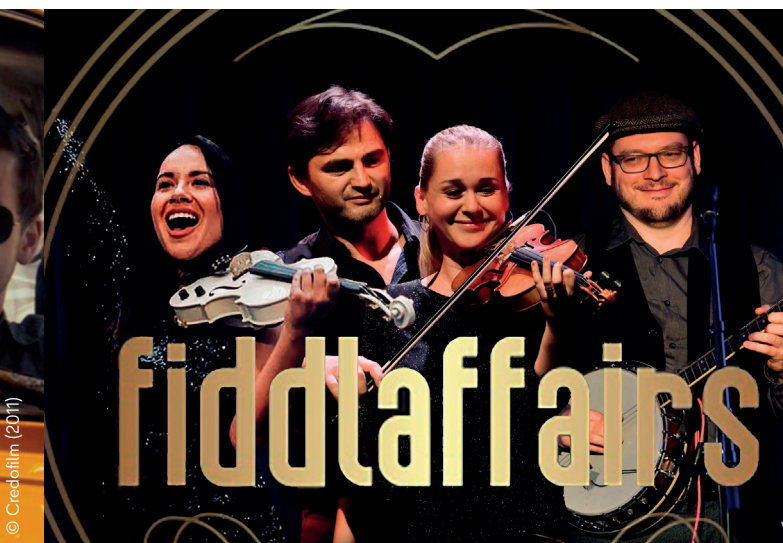
Fiddlaffairs Samstag, 30.11.2024, Beginn 20.00 Uhr

Aufgang A | Eintritt 6 € | Ermäßigt 3 € (siehe Hinweise)