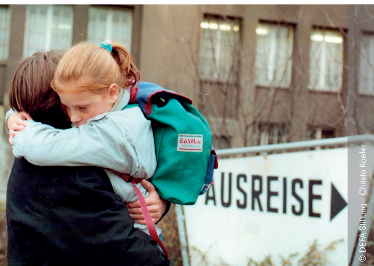
Die Architekten , DEFA 1990 Freitag, 08.11.2024, Beginn 19.30 Uhr