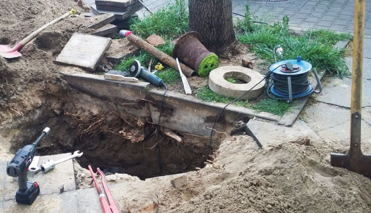
Wurzelschäden - Totalschaden für den Baum