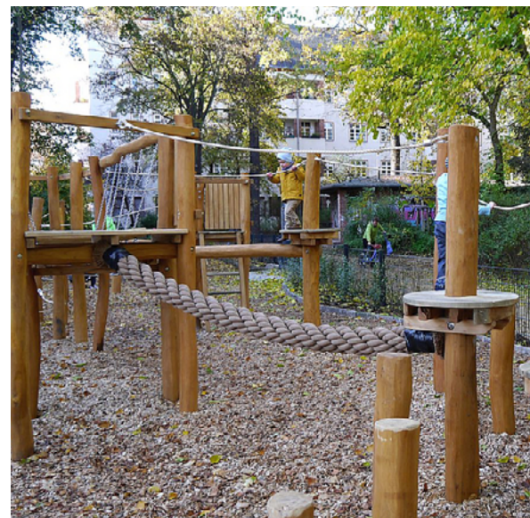
Der langgestreckte Kletterparcours aus niedrigen Stämmen und Seilen