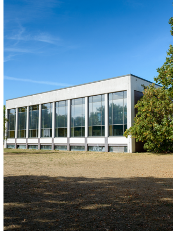
Stadtbad Tempelhof

Im südwestlichen Bereich des Gartendenkmals Franckepark wurde 2020 der vorhandene Spielplatz als Starterprojekt aufgewertet und erweitert. Vorangegangen war 2018 ein Planungsworkshop, an dem Kinder und Pädagoginnen zweier benachbarter Kitas und einer Grundschule teilnahmen. Ihre Ideen und Hinweise flossen in die Planung ein.