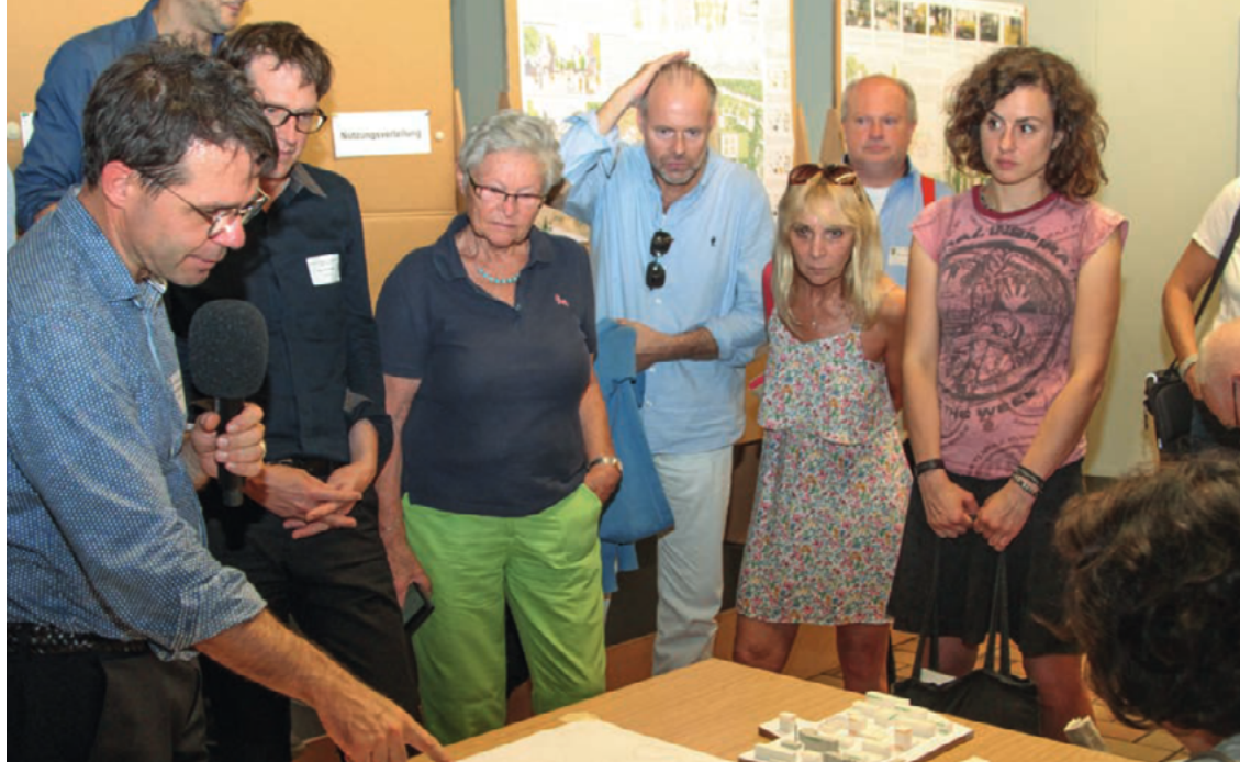
Die Erläuterungen am Entwurfsmodell des Gebietszentrum Halemweg ziehen alle Aufmerksamkeit auf sich.