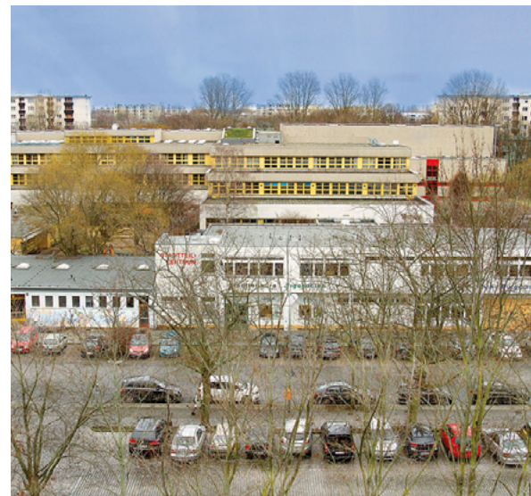
Das Nahversorgungszentrum Halemweg hat erheblichen Aufwertungsbedarf