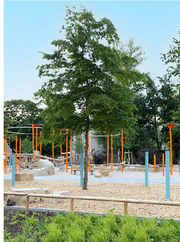
Neuer generationenübergreifender Spielplatz innerhalb der Grünverbindung Halemweg-Popitzweg

In mehreren Phasen soll der Bildungsstandort im Halemweg umstrukturiert werden. Im nördlichen Teilblock wurden bereits das Gebäude Halemweg 26-30 (ehemaliges Gesundheitsamt und Familienzentrum) sowie die Gebäude der ehemaligen Poelchau-Schule zurückgebaut. An dieser Stelle entsteht bis 2026 der Neubau des OSZ Sozialwesen der Anna-Freud-Schule. Nach dem Umzug der Anna-Freud-Schule sollen an ihrer Stelle ein neues klimafreundliches Wohnquartier und entlang des Halemwegs Neubauten für kulturelle und bildungsbezogene sowie nachbarschaftliche Einrichtungen entstehen. Außerdem wird die Erwin-von-Witzleben-Grundschule erweitert.