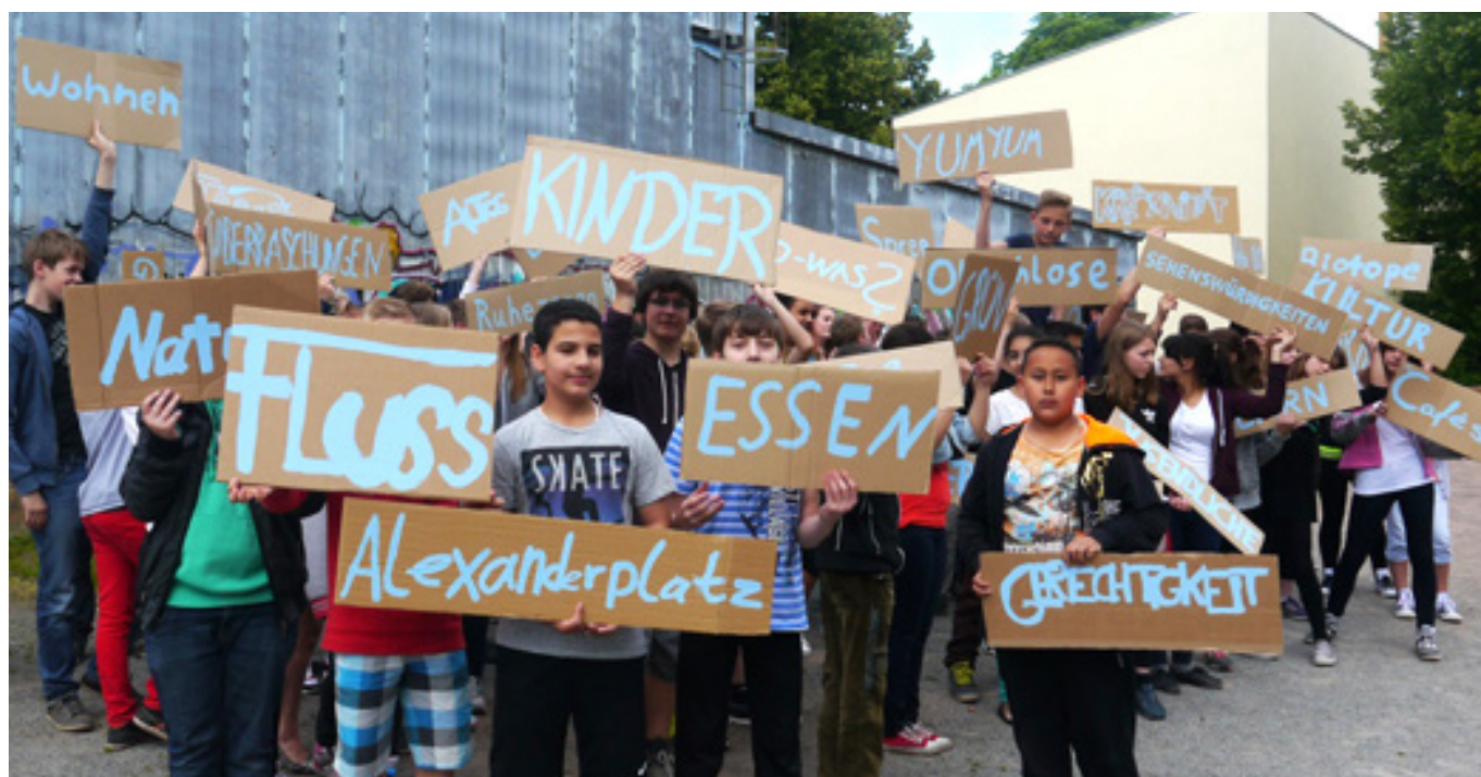
Projekt „Was formt die Stadt? Ein Alphabet“ an der Reinhold-Burger-Schule, Pankow.

Durch die Herangehensweise über die kulturelle Bildung wurden ungewöhnliche Zwischentöne und Ideen laut. Es vermittelten sich wichtige, unmittelbar formulierte Anhaltspunkte für Tendenzen und Haltungen innerhalb der Gesellschaft, die oft ganz persönliche Befindlichkeiten sichtbar machen –inspiriert von der Auseinandersetzung mit gesellschaftlichen und stadtentwicklungspolitischen Themen. Kulturelle Bildung kann für Stadtentwicklung auf diese Weise einen reichhaltigen Schatz von Ansatzpunkten für eine ebenso konstruktive wie kritische Auseinandersetzung mit der Entwicklung von Stadt bieten, die auf anderem Weg kaum zu erreichen ist.