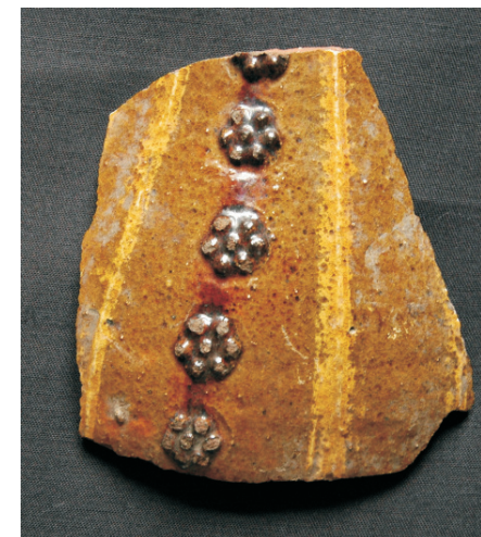
Abb.: Verzierte Keramik, 13. Jh, Lüdersstr. 12,14 in Berlin-Köpenick

18.00 Uhr Ausklang der Veranstaltung im Foyer Kinosaal