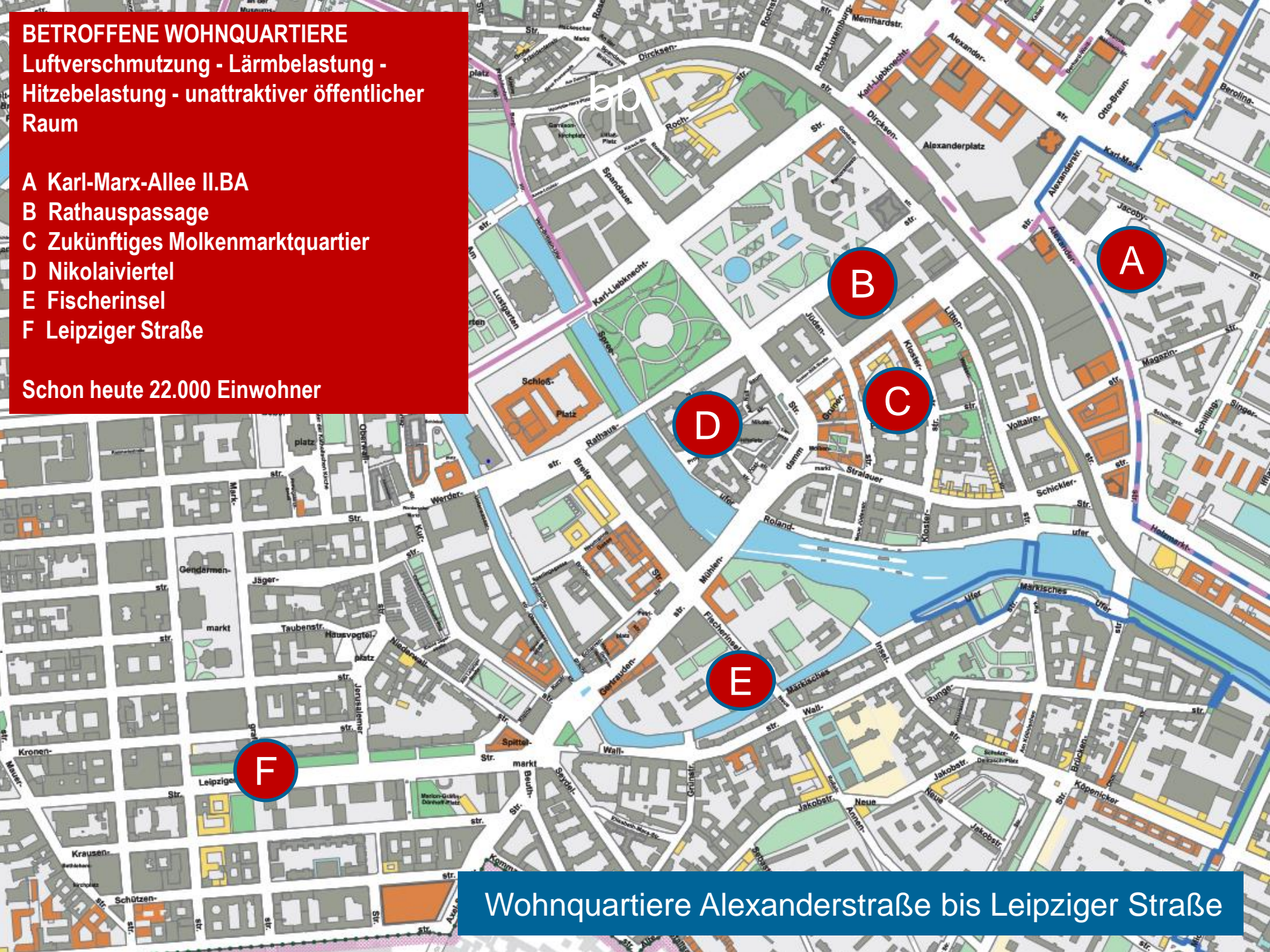
Wohnquartiere Alexanderstraße bis Leipziger Straße