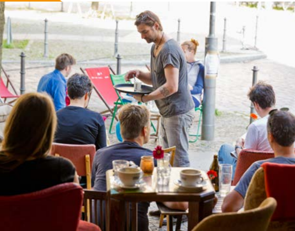
Café Nadia & Kosta in der Victoriastadt

Ob authentische ZEITGESCHICHTE in der Gedenkstätte Berlin-Hohenschönhausen, zeitgenössische KUNST in den B.L.O.-Ateliers, moderne KULTUR im Theater an der Parkaue, atemberaubender FREIZEITSPASS im Wellenwerk oder einzigartige NATURERLEBNISSE im Tierpark Berlin – hier finden alle Menschen MEHR BERLIN , als sie denken.