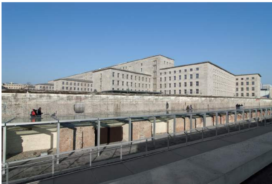
Dokumentationsstätte Topographie des Terrors.