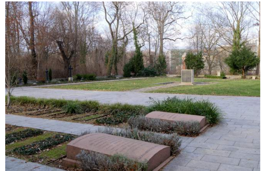
Friedhof der Märzgefallenen in Friedrichshain.