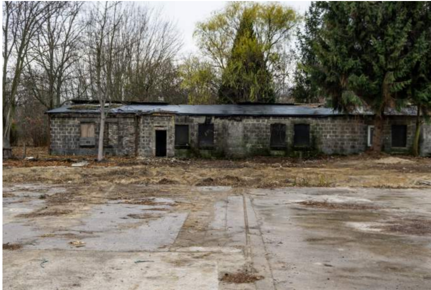
Unterkunftsbaracke im Kriegsgefangenenlager Stalag IIID in Lichterfelde-Süd.