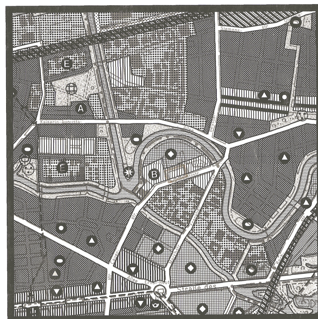
Zeichenerklärung zum FNP84 Maßstab 1:20000