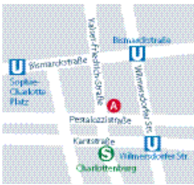
A Haus der Volkshochschule Pestalozzistraße 40/41