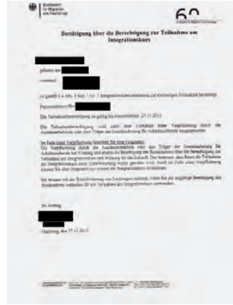
Bundesamt für Migration und Flüchtlinge