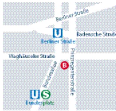
B Unterrichtsstätte Prinzregentenstraße 33-34