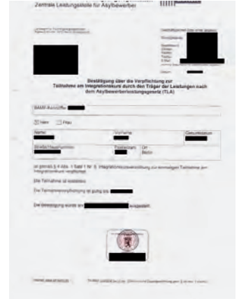
Landesamt für Flüchtlingsangelegenheiten